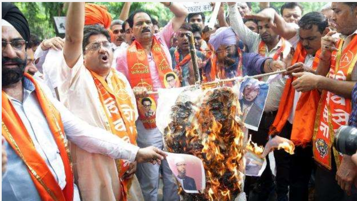
جایگاه نایک در جامعه مسلمان هند